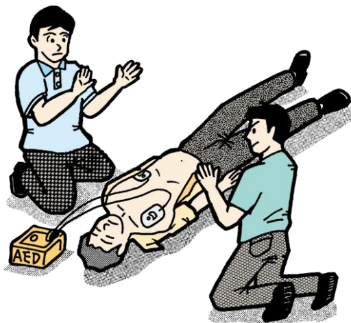
イラスト:小田純一(当消防本部職員)