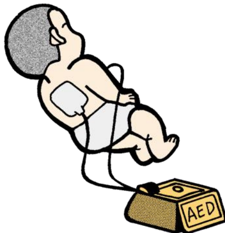
イラスト:小田純一(当消防本部・救急救命士)