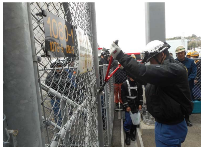
(緊急時立入り訓練)