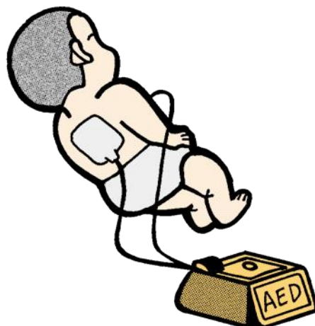
イラスト:小田純一(当消防本部・救急救命士)